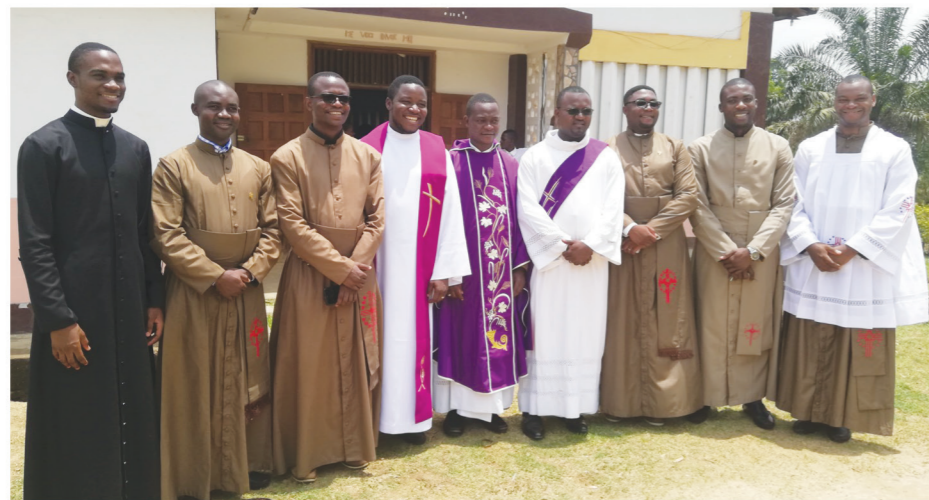
Visite au Petit Séminaire Saint-André de Bafia