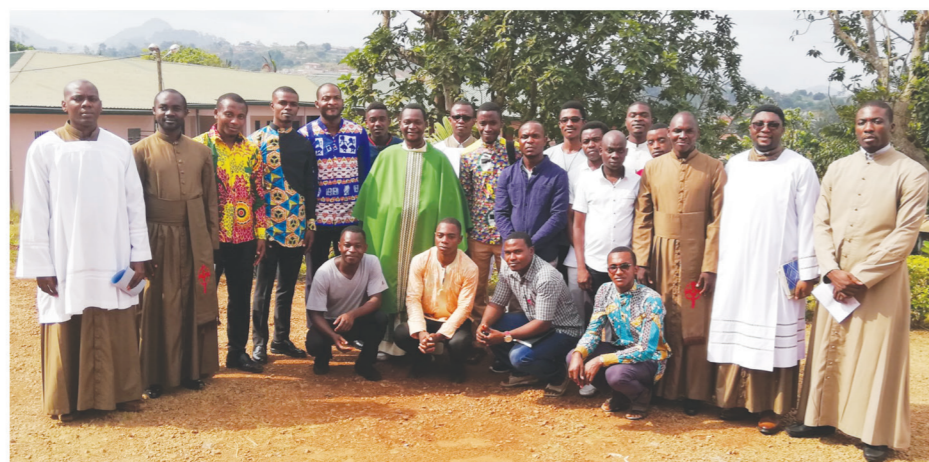
Matinées Vocationnelles MSA. A tout âge le Seigneur nous appelle