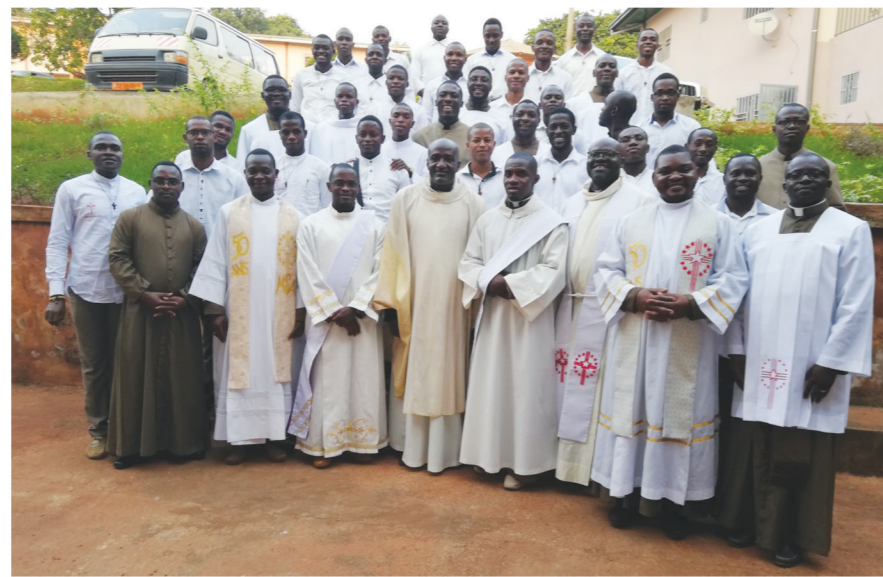
Célébration de la Noël en famille