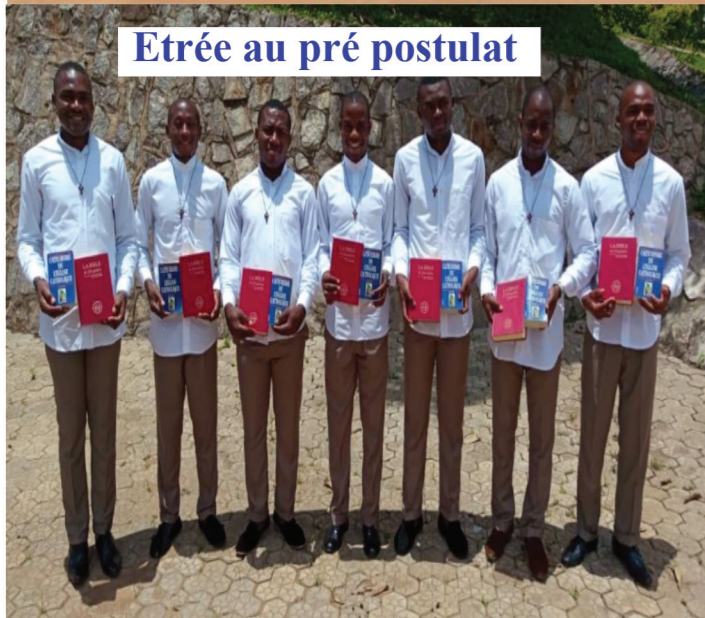
Etrée au pré postulat